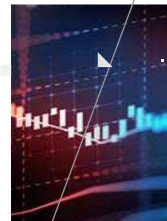
Powerpoint karakteristična stranica s jednom fotografijom

Fusce nec tellus sed augue semper porta. Mauris massa. Vestibulum lacinia arcu eget nulla. Maecenas mattis. Sed convallis tristique sem. Proin ut ligula vel nunc egestas porttitor. Morbi lectus risus, iaculis vel, suscipit quis, luctus non, massa.