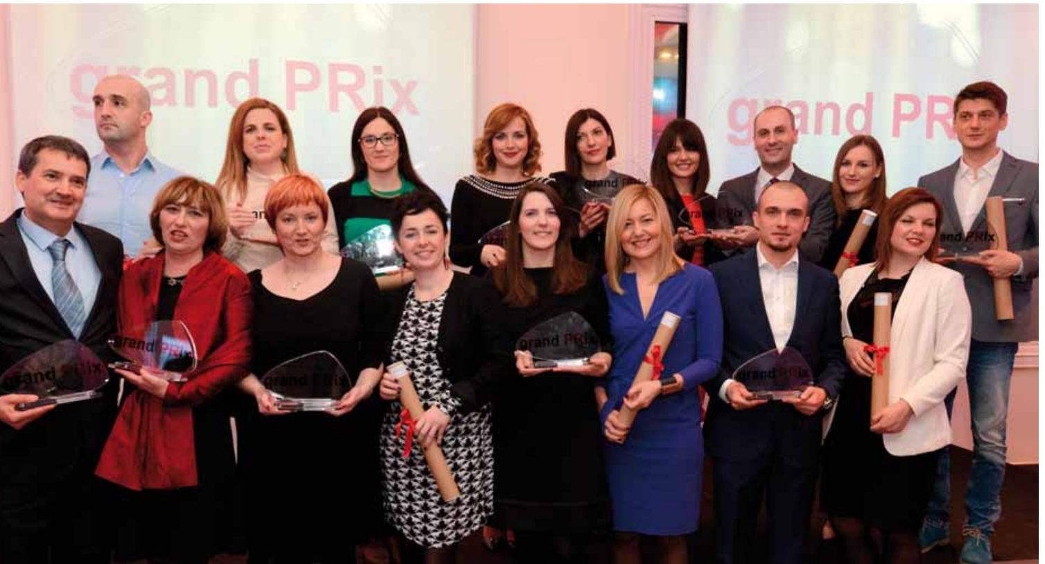
Predstavnici tvrtki s najboljim ostvarenjima u odnosima s javnošću u 2014. - nositelji Grand PRix 2015. nagrade Hrvatske udruge za odnose s javnošću